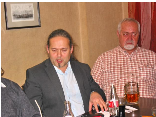
Př. poslanec v Zemek na našem jednání v Příbrami

konference se bude muset zabývat i nově zvolený Celostátní výbor KS ČSSD na svém prvním jednání.